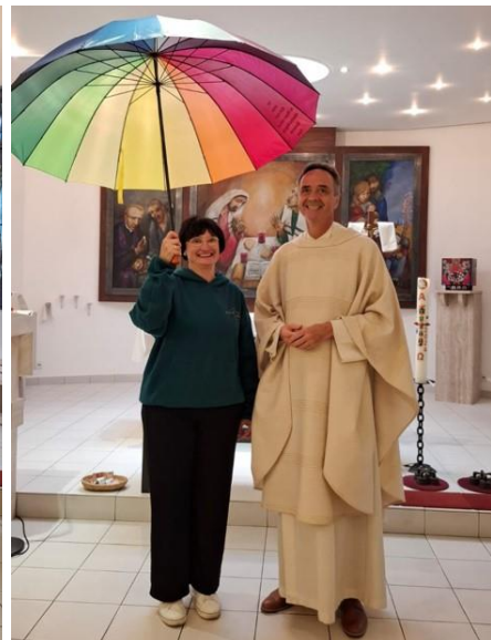
Jugendchor aus dem Raum Ravensburg zu Allerheiligen