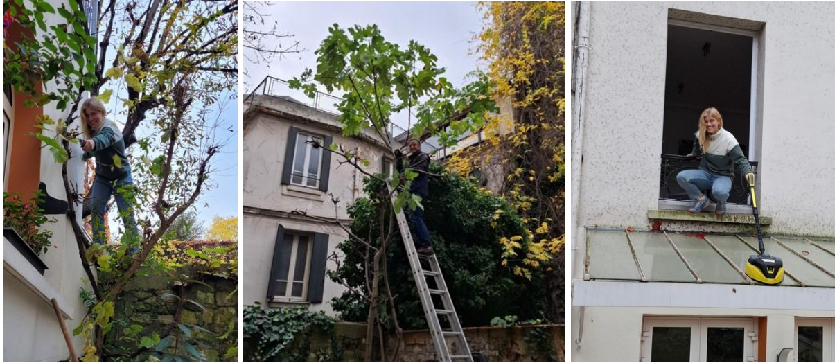
Herbstputz und Gartenarbeit in der Gemeinde