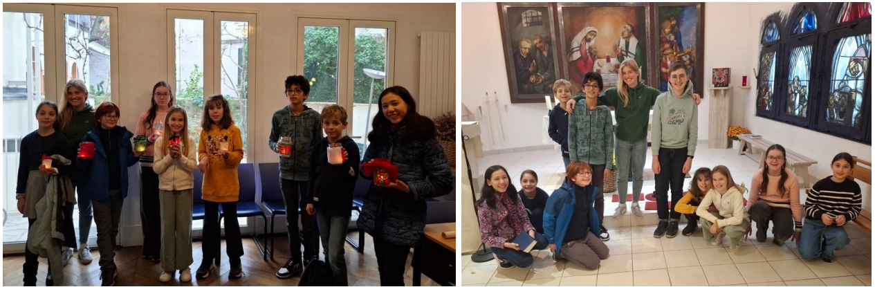
Ki-Ko-Fi Gruppe 12 Uhr