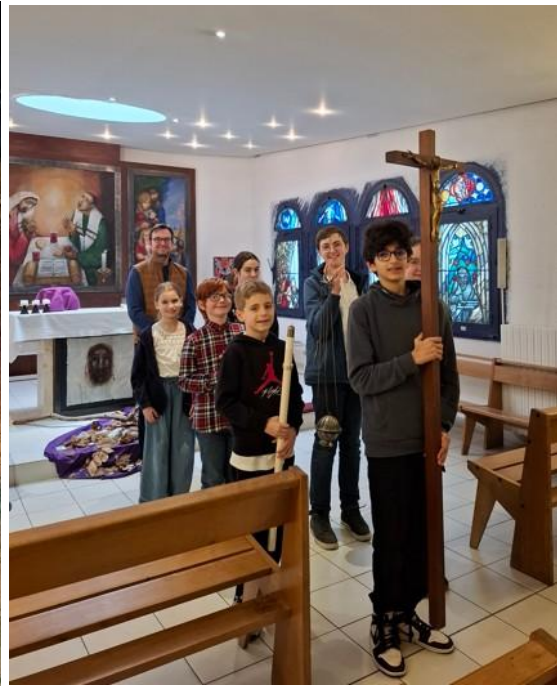
Probe der Minis