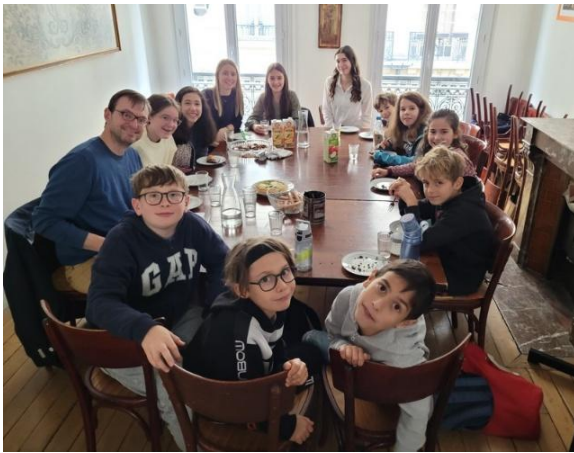
Unsere neue Ki-Fo-Fi und Mini-Gruppe