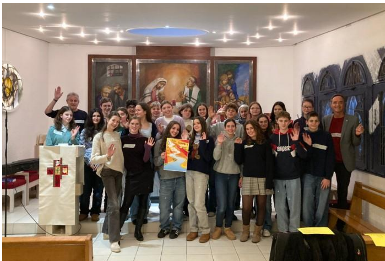
Ein Herzliches Willkommen an unsere neue Firmgruppe!