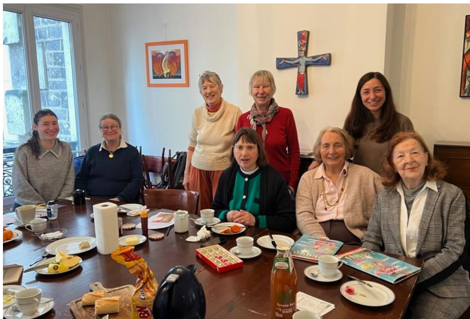
Unsere Damen vom Frauenkreis